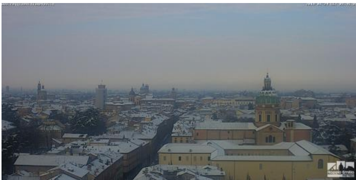
Nel seguente video la neve ieri in tarda serata a Parma: