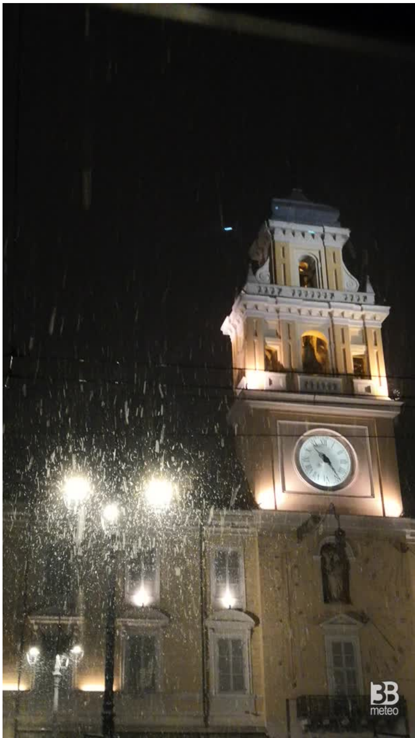
Nel seguente video la neve ieri in tarda serata a San Baronto (PT):