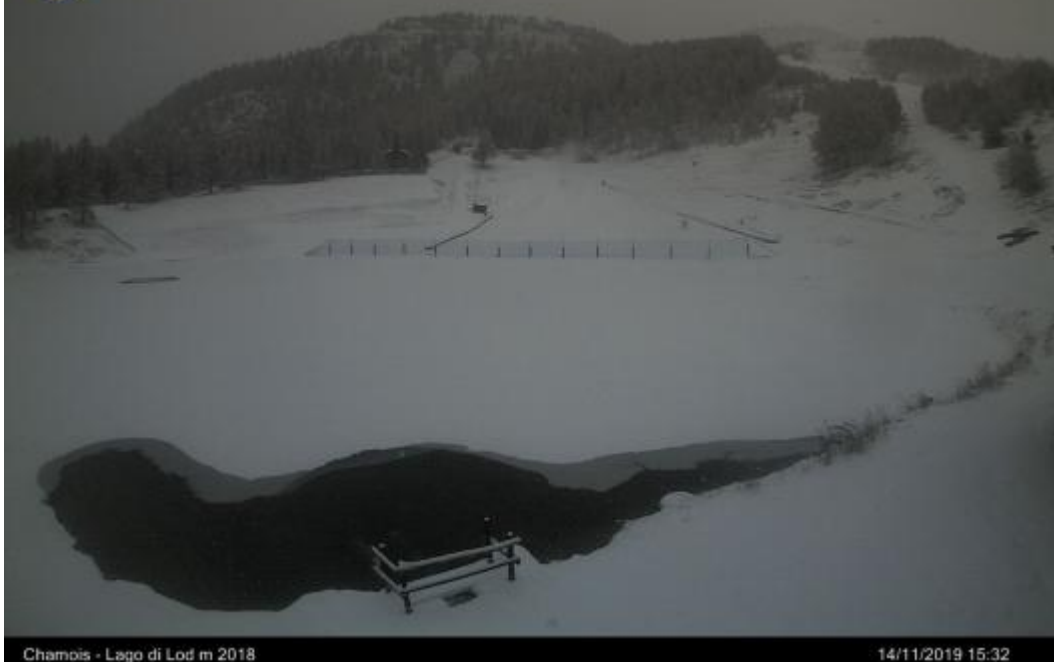
Chamois - Lago di Lod m 2018