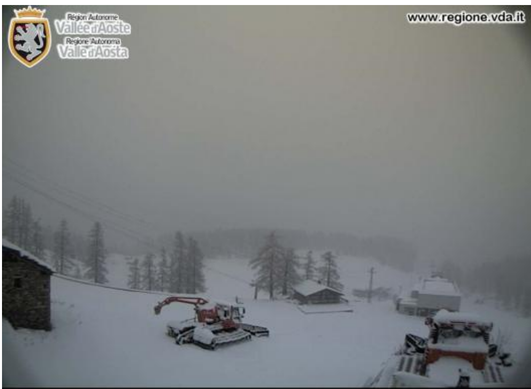
Champorcher - Loc. Laris m 1930