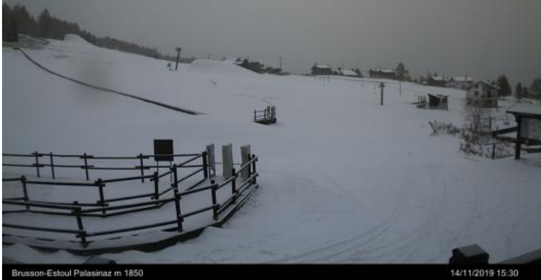
Brusson-Estoul Palasinaz m 1850