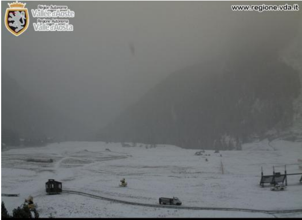
Cogne - Prati S. Orso e catena Gran Paradiso m 1544