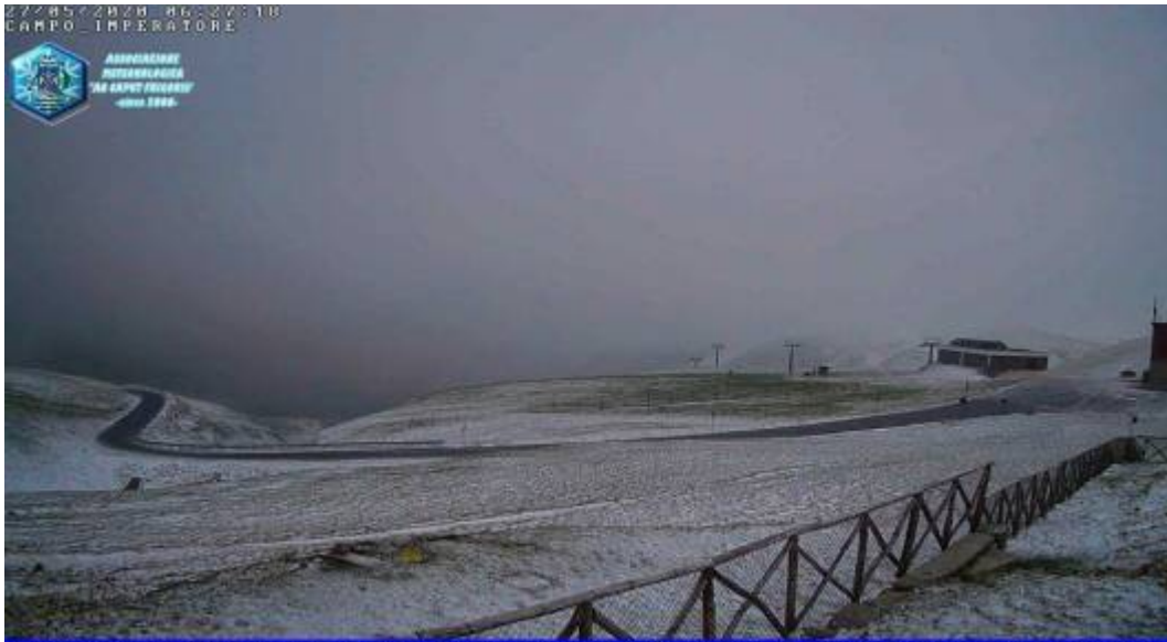
Campo Imperatore (AQ), 2132 m - Panoramica da sinistra sul sentiero del Centenario, con il monte Scintarella (2233 m) sulla destra - mar 27 mag 2020 06:27:41

ASSOCIAZIONE NATIONAL MOUNTAIN "AL CAPO IMPERATORE" 1909